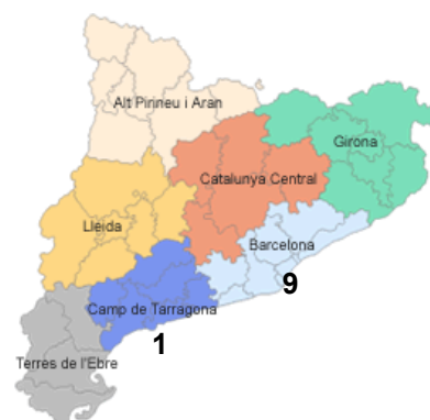
PIDIRAC 44 (3/9/09)